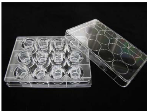
図 1 ad-MED ビトリゲル ® 2 (12 ウェル)

ad-MED ビトリゲル ® 2 (12 ウェル) (図 1) は、生体内の結合組織に匹敵する高密度コラーゲン線維構造を持つコラーゲンビトリゲル膜を使った細胞培養用器材です。細胞接着活性や細胞伸展活性が高いことが大きな特徴で、広範な細胞に対し、良好な細胞培養が可能です。