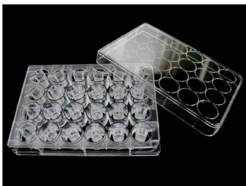
図 1 ad-MED ビトリゲル ® 2 (24 ウェル)

ad-MED ビトリゲル ® 2 (24 ウェル) (図 1) は、生体内の結合組織に匹敵する高密度コラーゲン線維構造を持つコラーゲンビトリゲル膜を使った細胞培養用器材です。細胞接着活性や細胞伸展活性が高いことが大きな特徴で、広範な細胞に対し、良好な細胞培養が可能です。